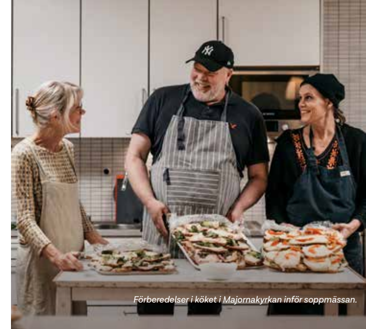
Förberedelser i köket i Majornakyrkan inför soppmässan.