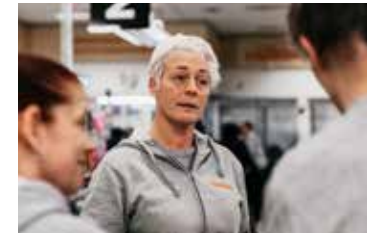
Rusning efter donerad mat i Rannebergen: "Den här affären har räddat folk"