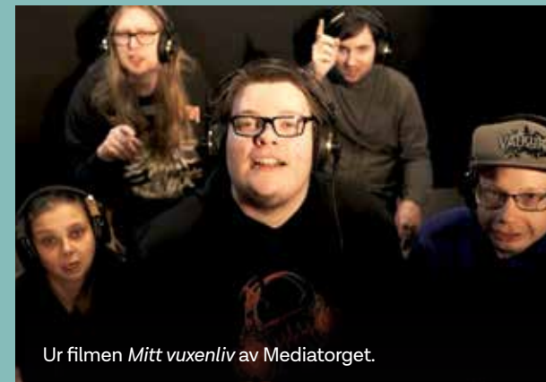
Ur filmen Mitt vuxenliv av Mediatorget.

Under året har vår dagliga verksamhet Mediatorget arbetat med att skapa en kurs i livskunskap för gymnasieskolornas nationella program, med ett tillhörande digitalt och interaktivt material. Projektet gjordes på uppdrag av Riksförbundet för utvecklingsstörda barn, ungdomar och vuxna (FUB) och resulterade i en välproducerad film som handlar om hur det är att flytta hemifrån samt vilka utmaningar det kan innebära. Syftet med filmen är att hjälpa ungdomar utforska sina vuxenliv och fundera kring hur olika val kan påverka livet. Filmen blandar allvar med komiska inslag, är informativ och kommer högst troligt ligga till grund för många givande samtal.