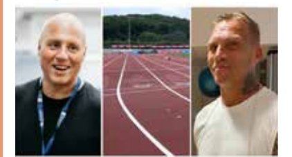
Nya projektet i Göteborg: Så ska människor hjälpas ur sitt beroende