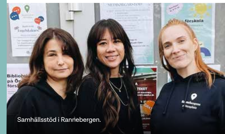
Samhällsstöd i Rannebergen.

Under hösten startade vi Samhällsstöd i Rannebergen. Samhällsstöd är ett samarbete mellan Räddningsmissionens rättighetsbaserade områdesarbete, MatRätt och Reningsborg och hjälper personer att navigera i välfärdssystemet. Frågorna kan vara stora och små. Det kan röra sig om hyresrättsfrågor, hjälp att skaffa bank-id, fondansökan eller kontakt med myndigheter. Sedan start har Samhällsstöd haft 74 samtal med 47 unika besökare. Ett lyckat initiativ som vi ser fram emot att utveckla.