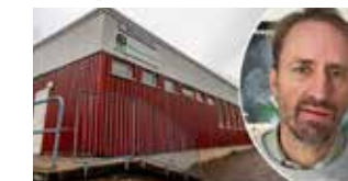
Räddningsmissionen tar över gamla Römossekolan: "Omtumlande"