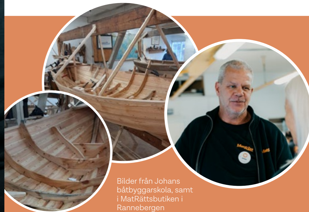
Bilder från Johans båtbyggarskola, samt i MatRättsbutiken i Rannebergen