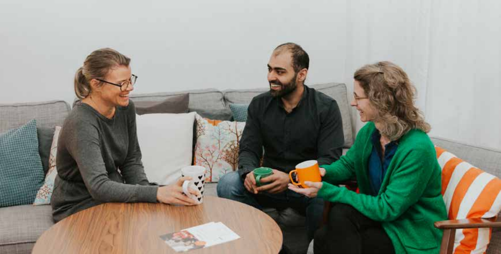
FEM ÅR EFTER FLYKTINGVÄGEN / TEXT: JOACHIM LUNDELL