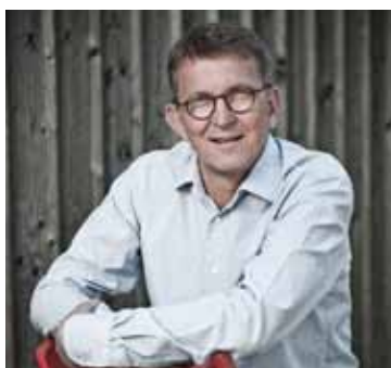
Tomas Sjödin författare, krönikör